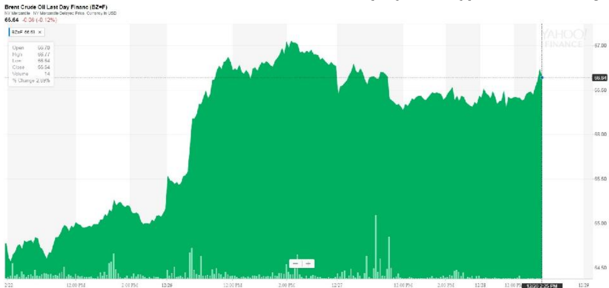
نمودار نفت برنت در طول هفته‌ای که گذشت

در مجموع با توجه به عوامل مورد اشاره، اکثر تحلیلگران انتظار دارند قیمت متوسط نفت برنت از حدود ۵۴ دلار در سال ۲۰۱۷ به زیر ۶۰ دلار در سال ۲۰۱۸ برسد. نظرسنجی رویترز از ۳۲ اقتصاددان و تحلیلگر نفتی نیز حاکی است، قیمت متوسط نفت برنت در سال ۲۰۱۸ میلادی به ۵۹ دلار و ۸۸ سنت خواهد رسید.