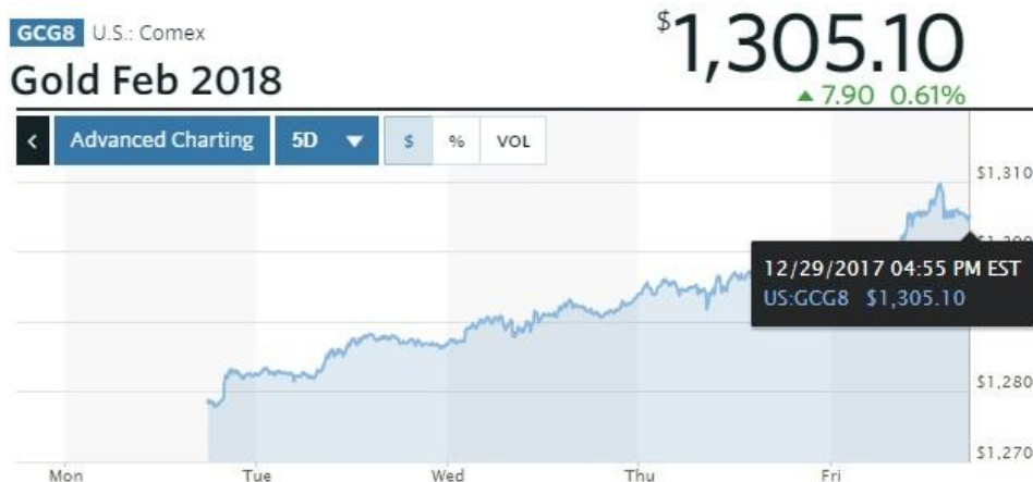
نمودار اونس طلای جهانی (تحويل فوریه ۲۰۱۸) در طول هفته‌ای که گذشت