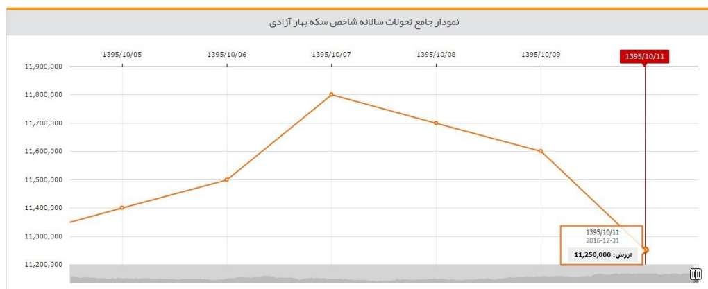
نمودار سکه نقدی بهار آزادی در طول هفته‌ای که گذشت

سکه نقدی هفته‌ی قبل در پی افزایش بی سابقه دلار افزایش یافت و تا کانال یک میلیون و دویست و بیست هزار تومان افزایش یافت. پس از افزایش‌های پی در پی دلار، سکه نقدی نیز افزایش بی سابقه‌ای نمود و تمامی سقف‌های اخیر خود را شکست. البته این سقف فقط شامل قیمت سکه نبود و حباب سکه نیز تا رقم بی سابقه‌ی صد و سی هزار تومان رسید که در خور تأمل است. همچنین بازار آتی نیز افزایش بی سابقه‌ای داشت و بعد از مدت‌ها صف خرید را به خود دید. حجم معاملات آن نیز رکوردی بی سابقه داشت. اما در انتهای هفته و با فروکش کردن عطش دلار، سکه و در پی آن بازار آتی نیز با کاهش روبه رو شدند و انتظار می‌رود این کاهش قیمت‌ها برای هفته‌ی آتی نیز ادامه‌دار باشد.