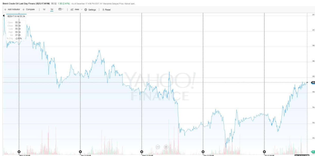
نمودار نفت برنت در طول هفته‌ای که گذشت

قیمت نفت خام در معاملات بین المللی آخرین روز کاری هفته گذشته تحت تأثیر نشانه‌هایی مبنی بر کاهش حجم تولید نفت از سوی تولیدکنندگان بزرگ افزایش یافت، گرچه همچنان نگرانی‌ها در مورد رشد تولید نفت شیل آمریکا ادامه دارد. بدین ترتیب، قیمت نفت خام برنت در بازار ICE لندن برای تحویل در ماه فوریه در معاملات روز جمعه با ۱,۱۹ دلار (۲,۲ درصد) رشد، در سطح بشکه ای ۵۵,۲۱ دلار به تثبیت رسید که این میزان ۱,۷ درصد نسبت به هفته قبل از آن افزایش نشان می‌دهد. همچنین، قیمت نفت خام WTI در بازار نایمکس نیویورک برای تحویل در ماه ژانویه با ۱ دلار (۲ درصد) افزایش، در سطح بشکه ای ۵۱,۹۰ دلار قرار گرفت که این رقم در مقایسه با هفته گذشته ۰,۸ درصد رشد نشان می‌دهد. انتشار اخباری مبنی بر کاهش عرضه نفت به مقاصد آمریکا و اروپا از سوی شرکت نفت کویت (KPC) موجب شد تا فضای روانی منفی بازار نسبت به اجرای توافق اخیر تولیدکنندگان بزرگ در خصوص کاهش حجم تولید نفت تعدیل شده و باعث بالا رفتن سطح قیمت نفت خام در معاملات روز جمعه شود. البته باید به این نکته اشاره نمود که فضای بازار نفت با توجه به تصمیم اخیر فدرال رزرو آمریکا برای افزایش نرخ بهره (تقویت ارزش دلار در مقابل سایر ارزها) برای رشد قیمت نفت خام مساعد نبود اما اخبار مذکور باعث شد تا اثرات کاهنده تغییر مذکور نرخ بهره بر روی قیمت نفت خنثی گردیده و در نهایت قیمت در روز جمعه افزایش یابد.