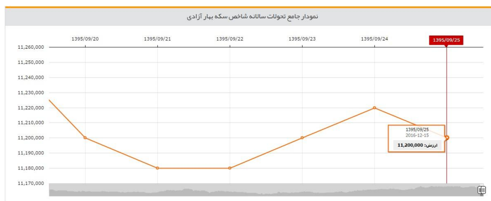
نمودار سکه نقدی بهار آزادی در طول هفته‌ای که گذشت

حباب سکه در بازار نقدی به ۸۰ هزار تومان رسید. پس از کاهش اونس، باز هم سکه در مقابل کاهش مقاومت از خود نشان داد و حباب آن افزایش بی سابقه‌ای به خود گرفته است. میل به خرید و تأثیر از افزایش دلار عامل اصلی این حباب می‌باشد. در حال حاضر قیمت سکه نقدی به ۱،۱۳۸،۰۰۰ تومان می‌رسد. این وضعیت به مراتب بدتر در بازار آتی نیز برقرار می‌باشد و نوسان در بازار آتی در حال تبدیل به امر بی معنایی می‌گردد و این بازار به شدت از نبود نقدینگی رنج می‌برد. در هر صورت با وجود نوسانات خوب اونس فعلاً بازار سکه و آتی حال و روز خوشی ندارند.