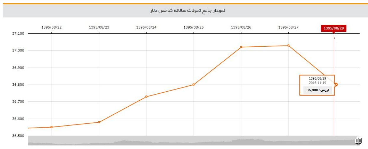
نمودار دلار بازار آزاد در طول هفته‌ای که گذشت